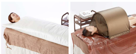
ヒートマットとの併用

上半身だけ、下半身だけ等、部分使いもOK、スッキリしたい部分に当ててお使いいただけます。